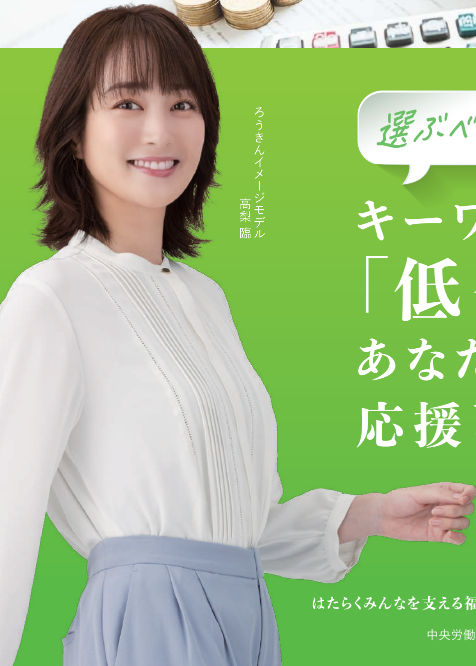
ろうきんイメージモデル 高梨臨